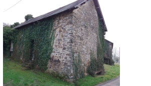
11 La Nauche