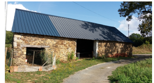
20 Les Escures