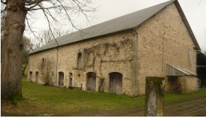
9 La Rougerie