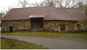
1 La Jarrige