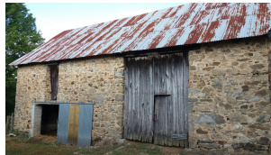
19 La Nauche