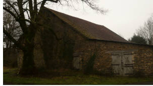
2 La Jarrige