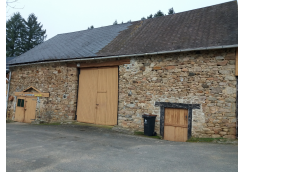
10 Le Maffreix