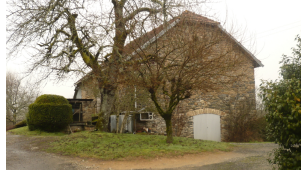
3 Le Cheyron