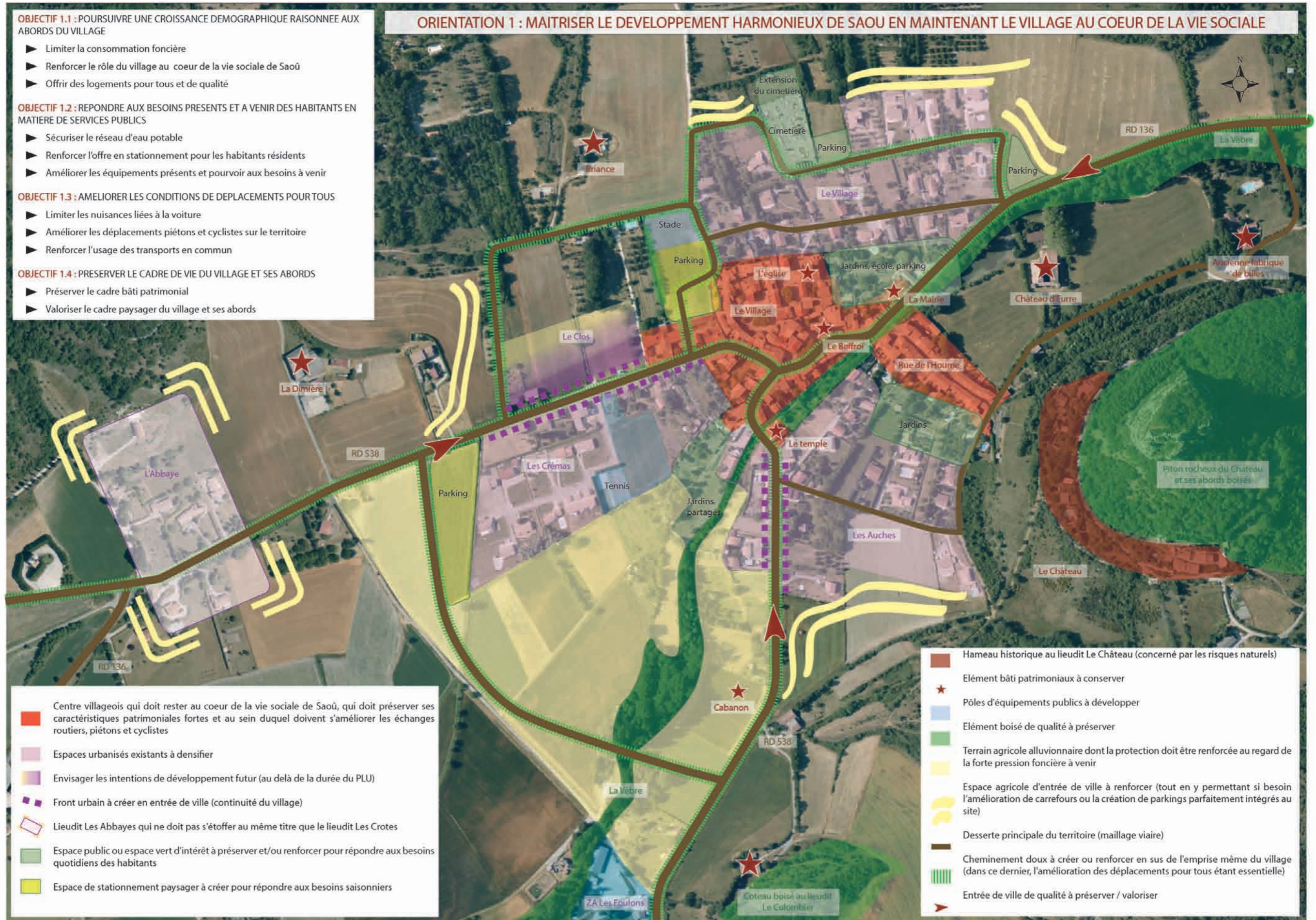
ILLUSTRATIONS DE L'ORIENTATION N°1 : MAITRISER LE DEVELOPPEMENT HARMONIEUX DE SAOU EN MAINTENANT LE VILLAGE AU COEUR DE LA VIE SOCIALE