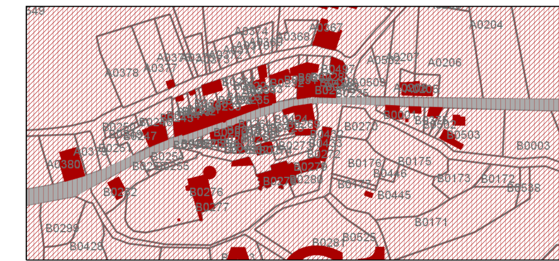
Extrait au 1/2000 ème - Village