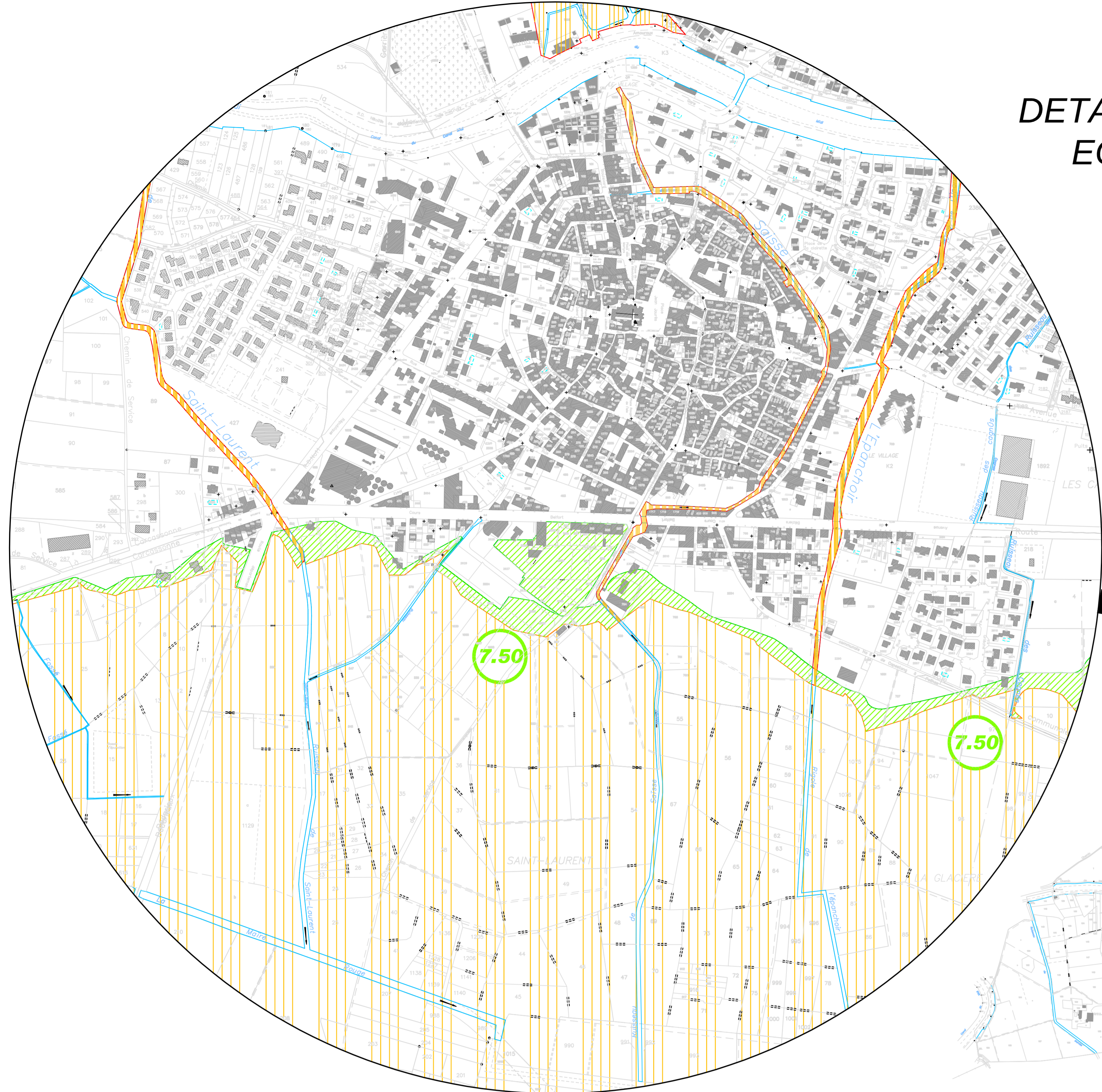
DETAIL CENTRE VILLE ECHELLE 1/3500