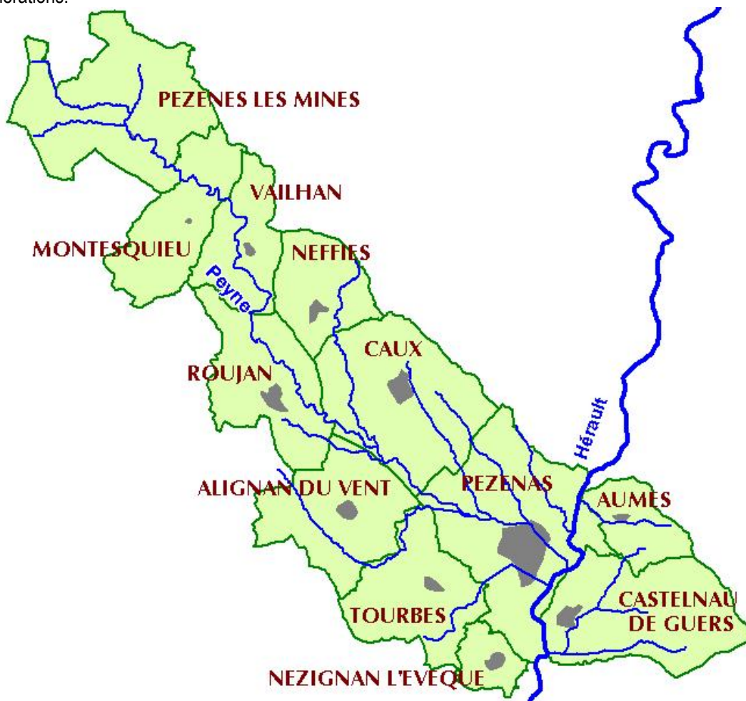
Carte des communes incluses dans le PPRI de la PEYNE

Enfin, hormis Pézenas en aval et Pézènes les Mines très en amont, la Peyne ne traverse pas d'autres agglomérations.