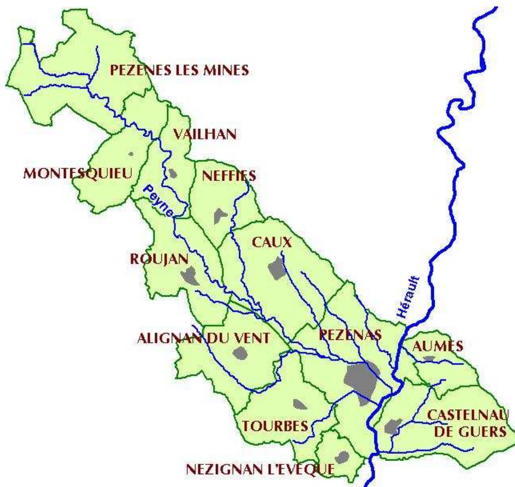
Carte des communes incluses dans le PPRI de la PEYNE

Deux, communes, bien que n'appartenant pas au bassin versant de la Peyne, Aumes et Castelnaud de Guers, ont néanmoins été rattachées à ce PPRI.