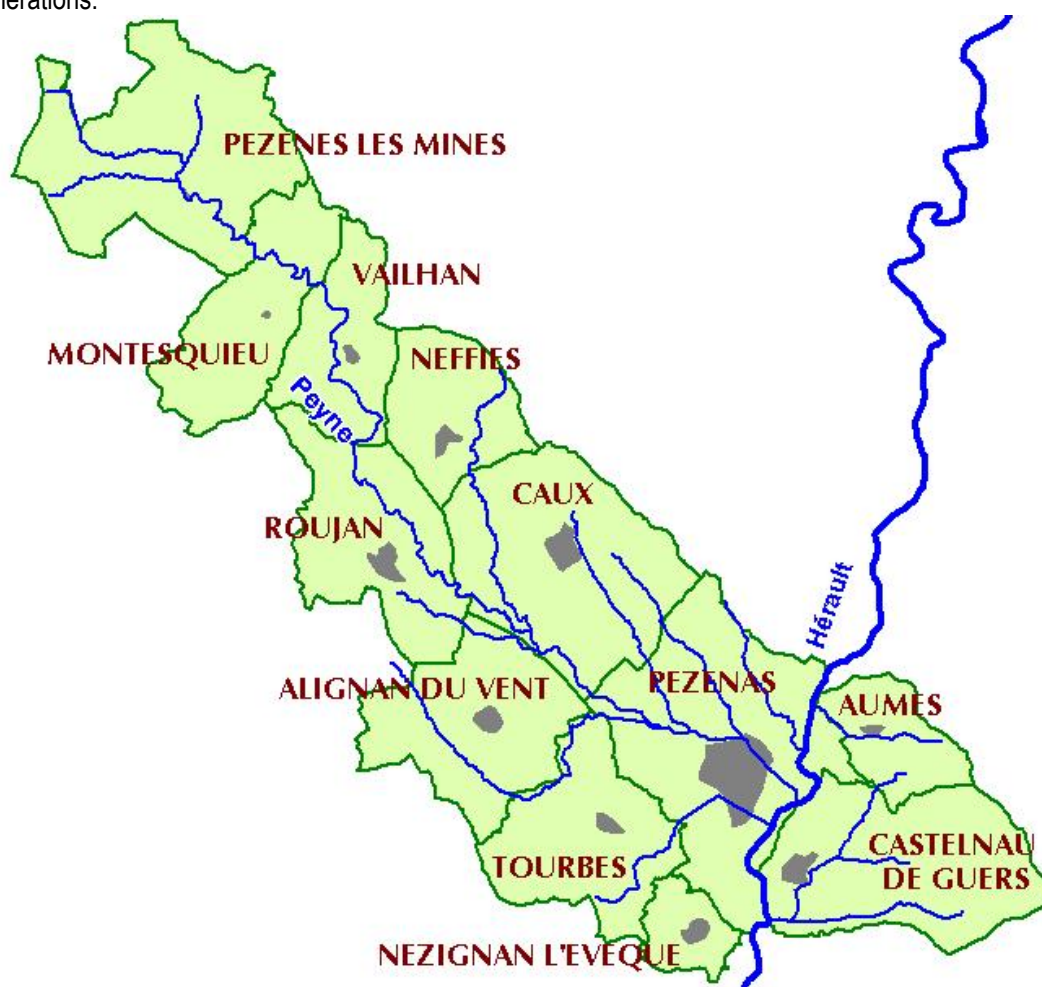
Carte des communes incluses dans le PPRI de la PEYNE

Enfin, hormis Pézenas en aval et Pézènes les Mines très en amont, la Peyne ne traverse pas d'autres agglomérations.