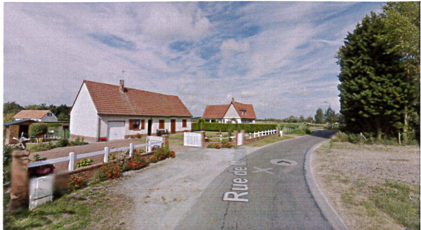
pavillons en entrée de village