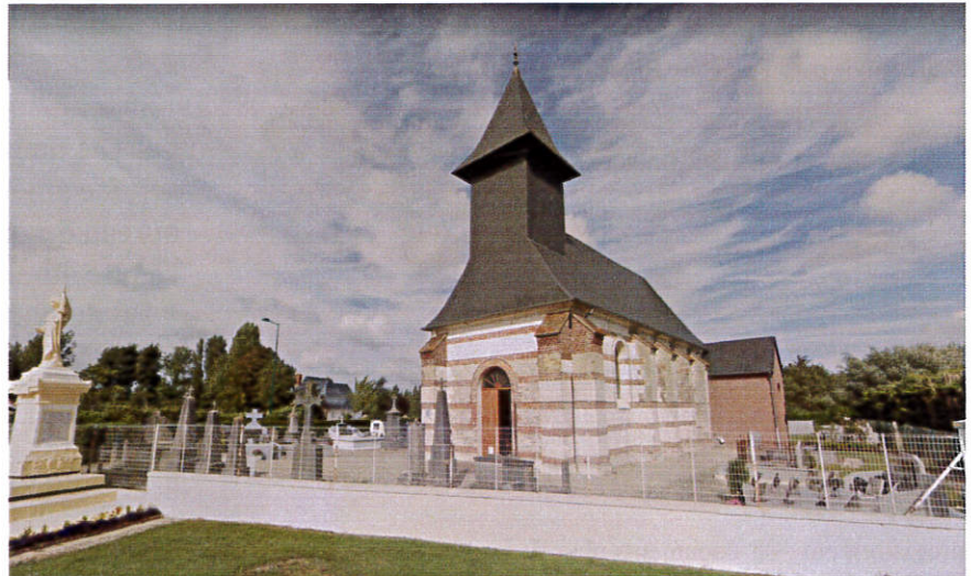
église en brique et pierre, entourée du cimetière

Située au cœur du village, l'église actuelle date de la fin du XVIIIe siècle (1778). Elle a été construite après que les deux précédentes ont été ensevelies par les sables.