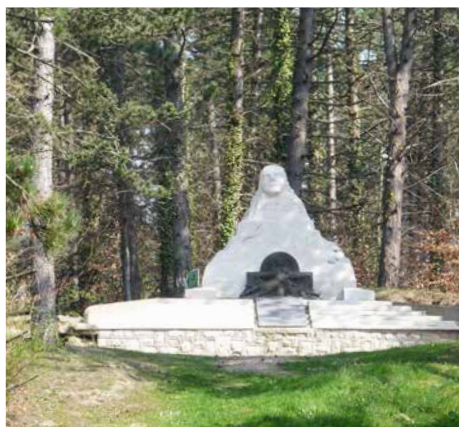
Monument du 106 ème R.I.

Une certaine sérénité propice au recueillement s'est installée au cœur de ce site.