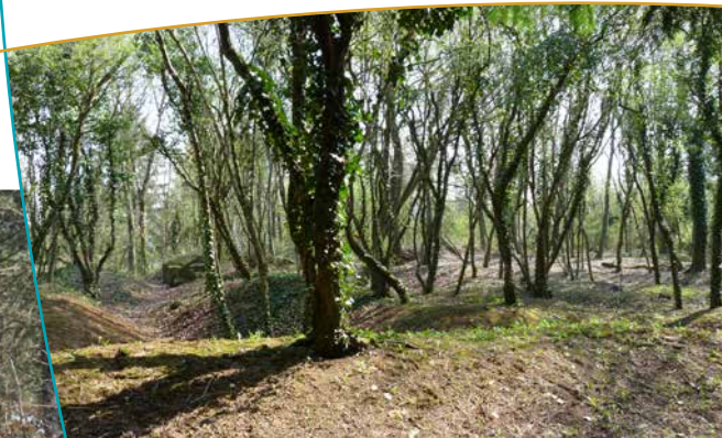
Forêt au sol bouleversé