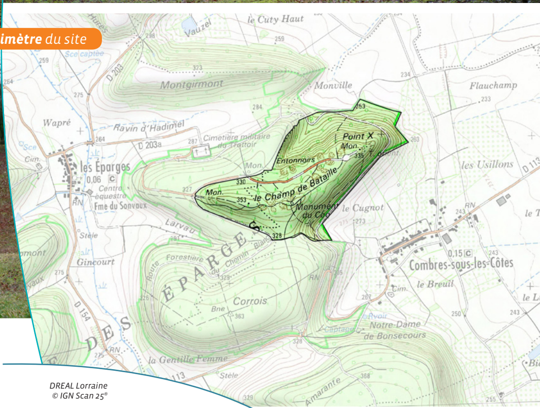
Périmètre du site