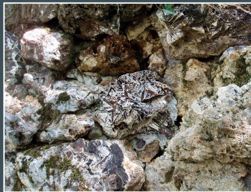
Bloc de quartz de l'oratoire montrant une très belle texture en lames

Les landes serpentiniques représentent des écosystèmes originaux, qui recèlent un patrimoine biologique d'une grande rareté dont les principaux milieux et espèces présents sont reconnus d'intérêt communautaire : Agrion de mercure, Damier de la succise, Ecaille Chinée, Lucane cerf volant.