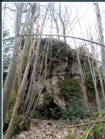
Affleurement de quartz oxydé bréchique sur lequel est bâti l'oratoire (P. BRUNETON)