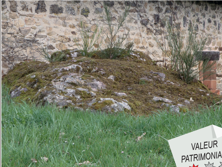
Affleurements du filon de quartz bréchique et oxydé dans les jardins de la Roche l'Abeille ( P. BRUNETON)