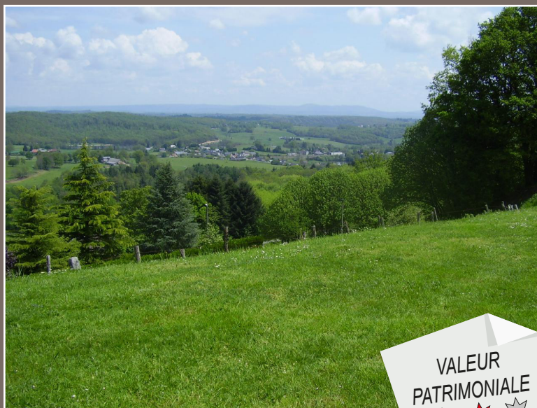
Pénéplaine post-hercynienne de Masseret (H. BRIL)