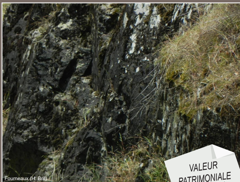
Fourneaux (H. Brill)