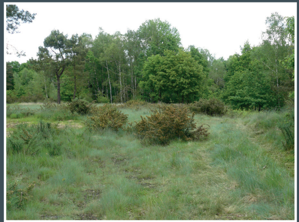
Le four

Le site est évocateur de la vie des tuiliers qui ont su par leur savoir-faire produire des tuiles plates à partir d'une argile locale. Les différentes étapes de fabrication de l'extraction à la cuisson sont illustrées sur le lieu.