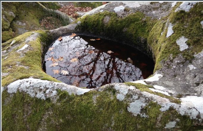
Pierre aux neuf gradins

Le leucogranite observable sur le site permet de retracer l'histoire de la mise en place tardive des magmas dans la chaîne hercynienne.