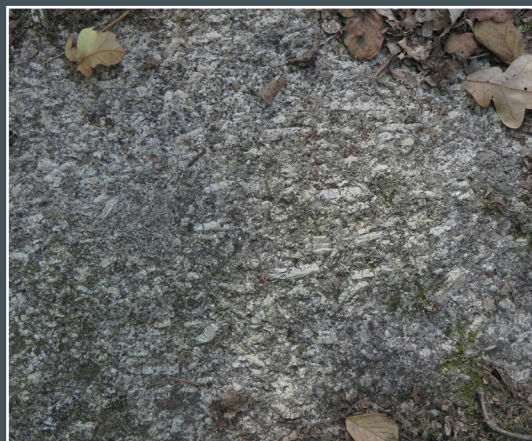
Pierre aux neuf gradins Faciès du granite de Soubrebost avec feldspaths alignés

Plutonisme: Ensemble des processus de formation de certaines roches magmatiques (exemple : granite) liés à la remontée du magma dans l'écorce terrestre.