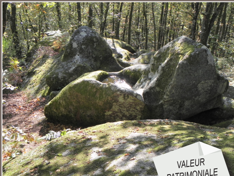
Pierre aux neuf gradins Vue générale