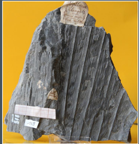
Sigillaria elongata

Les collections sont des témoins précieux des exploitations anciennes de minéraux et de charbon de la Creuse et du Limousin. Le lien avec des sites valorisés (Bosmoreau-les-mines) est à souligner. Le caractère encyclopédique du musée soutient cette dimension historique.