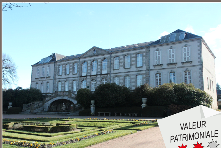
Musée municipal d'art et d'archéologie de Guéret