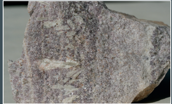
Détail des feldspaths orientés de la zone complexe

La pegmatite a été exploitée pour la lépidolite et aussi dans ses prolongements nord-est pour le feldspath pour la fabrication de pâtes à porcelaine.