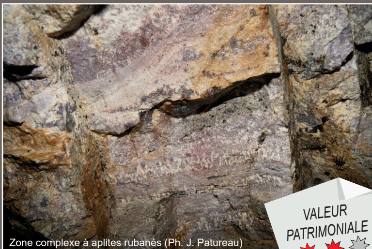
Zone complexe à aplites rubanés