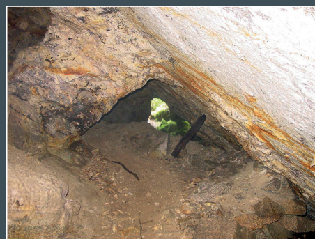
Une des galeries de Chédeville