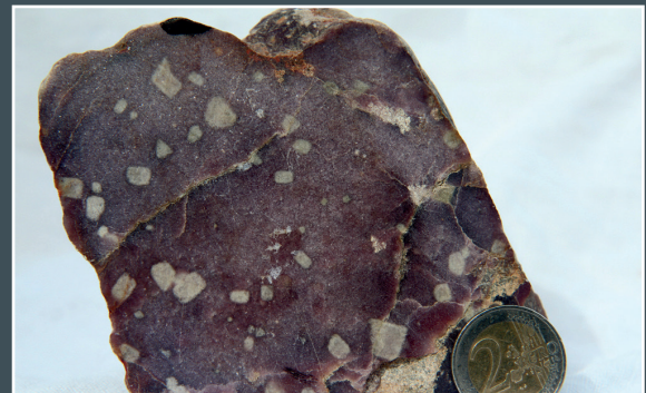
Cristaux de topaze dans lépidolite