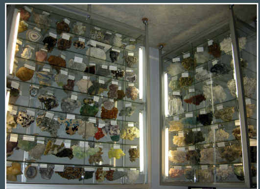
Espace météorite

Collection Chassignol et minéraux du monde entier.