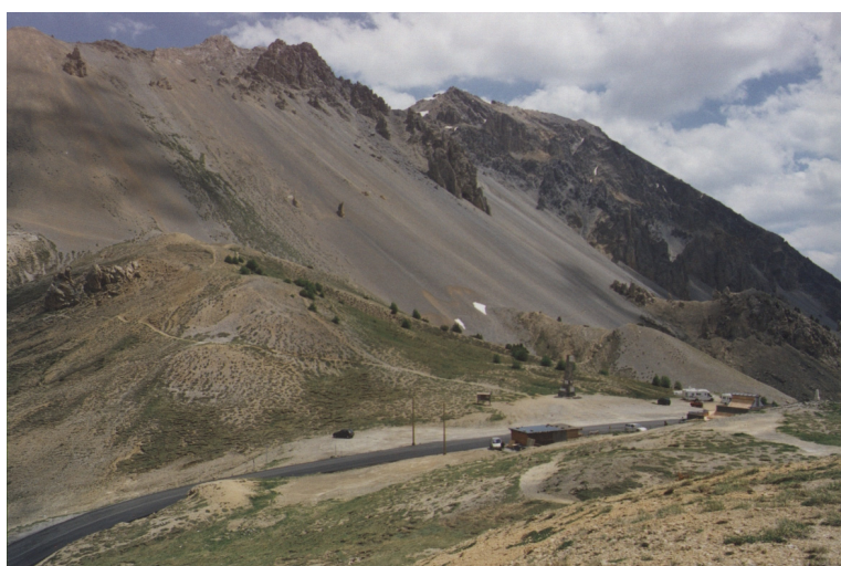
Vue du site depuis le col de l'Izoard, situé hors périmètre