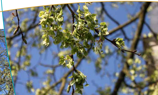
Fleurs de l'Orme